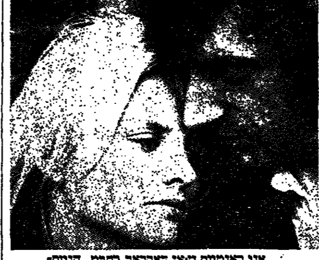
אני באנשים והאן דקלקר כפרם, הגוסס